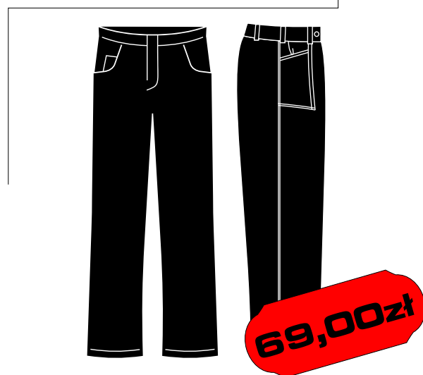
Spodnie do pasa - R2