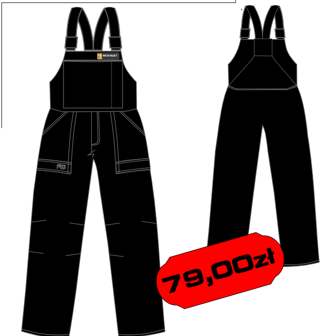
Spodnie ogrodniczki - R14