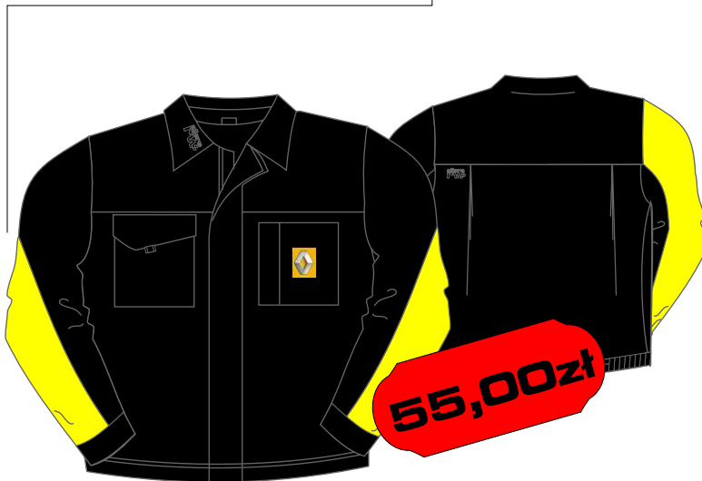
Bluza do pasa - R8