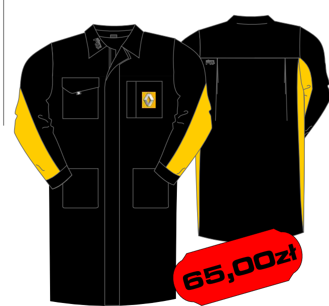
Fartuch długi - R11 opcja damska - R12